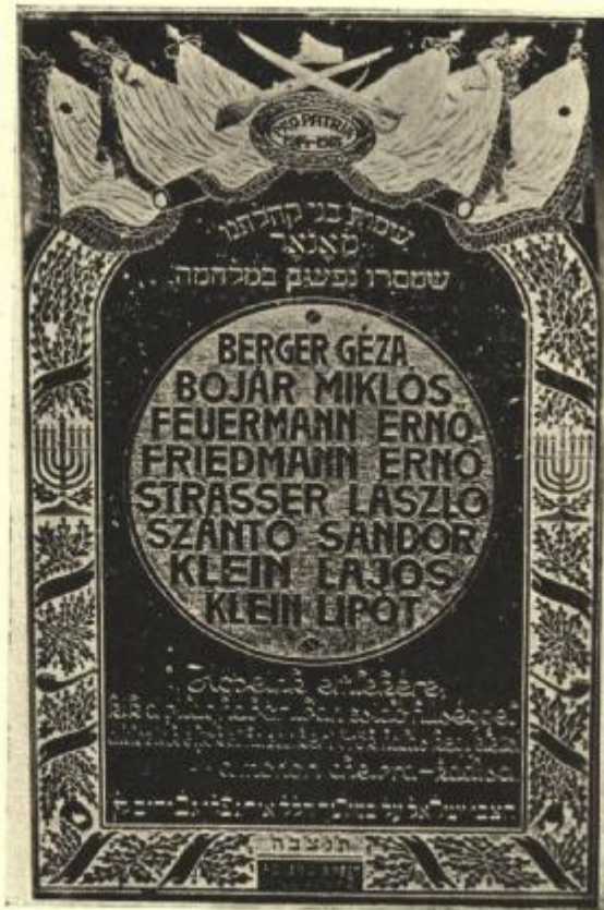
Monori hősi halottak emlékműve